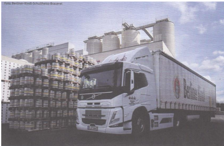
Die Berliner-Kindl-Schultheiss-Brauerei hat den Probebetrieb mit E-LKWs des Typs Volvo FM Electric gestartet

Die batterieelektrischen LKW sind Fahrzeuge vom Typ Volvo FM Electric mit einer Reichweite von 300 km. Bei den LKW handelt es sich um Zweiachser Sattelzugmaschinen mit einem zulässigen Gesamtgewicht von 44 t. Die E-LKW übernehmen Voll- und Leergutfahrten in Berlin und Potsdam bis nach Mecklenburg-Vorpommern. In dem laufenden Projekt sollen die E-LKW eine Jahreslaufleistung von 60.000 km erbringen. Bei den zwei vorhandenen E-LKW schätzt man jährlich mit einer Einsparung von 140 t Co2 gegenüber der herkömmlichen Transporttechnologie.